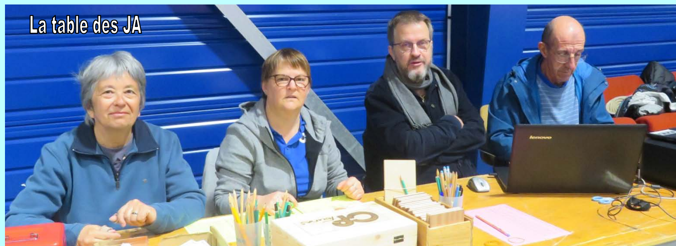
La table des JA